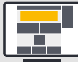
Wideboard Desktop 994 x 250 px (Dateigrösse: max. 500 KB)