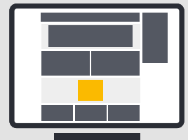
Rectangle Desktop 300 x 250 px (Dateigrösse: max. 250 KB)