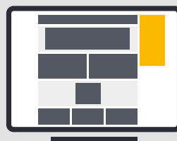
Halfpage nur Desktop 300 x 600 px (Dateigrösse: max. 500 KB)

Banner bleibt beim Scrollen auf dem Bildschirm stehen. (Fachsprache: «sticky»).